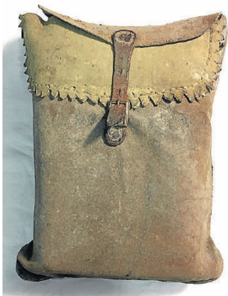
Morral utilizado por un emigrado en EE. UU. T. P.