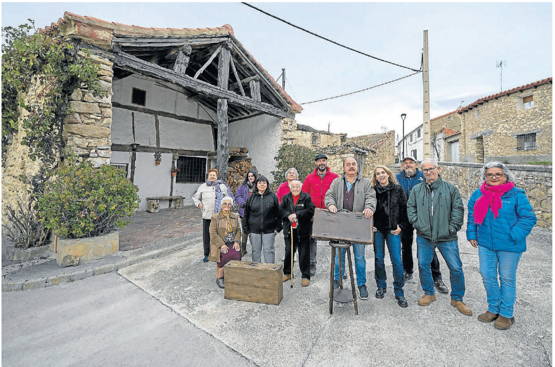
Vecinos de Jabaloyas con antepasados o familiares emigrados a Estados Unidos y México posan con las maletas que utilizaron los emigrantes hace un siglo.

P4 | AUGUSTO FERRER-DALMAU. UN CUADRO DE LA PRINCESA LEONOR PARA LA ACADEMIA GENERAL MILITAR P5 | JOSÉ JAVIER GALLARDO. «ZARAGOZA OFRECE MÚLTIPLES CAPAS DE CULTURA E INNOVACIÓN»